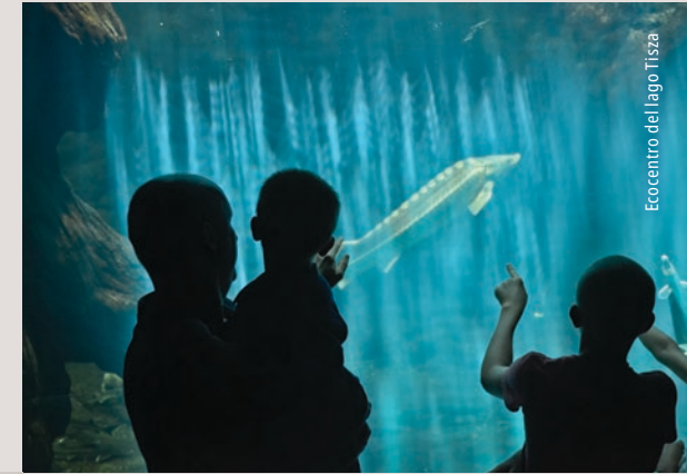
EcoCentro del lago Tisza

Visite el EcoCentro del lago Tisza, donde podrá descubrir los tesoros naturales del lago y del valle de una manera divertida con la ayuda de dispositivos modernos e interactivos, recorriendo el impresionante parque acuático de siete hectáreas que también dispone de un parque infantil acuático. En el pasillo subacuático de la instalación, a través de los cristales también podrá observar enormes esturiones.