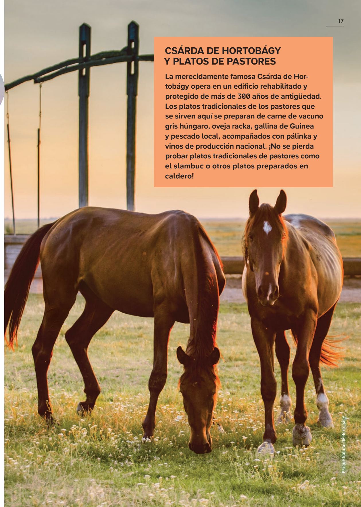
Parque Natural de Hortobágy

La merecidamente famosa Csárda de Hortobágy opera en un edificio rehabilitado y protegido de más de 300 años de antigüedad. Los platos tradicionales de los pastores que se sirven aquí se preparan de carne de vacuno gris húngaro, oveja racka, gallina de Guinea y pescado local, acompañados con pálinka y vinos de producción nacional. ¡No se pierda probar platos tradicionales de pastores como el slambuc o otros platos preparados en caldero!