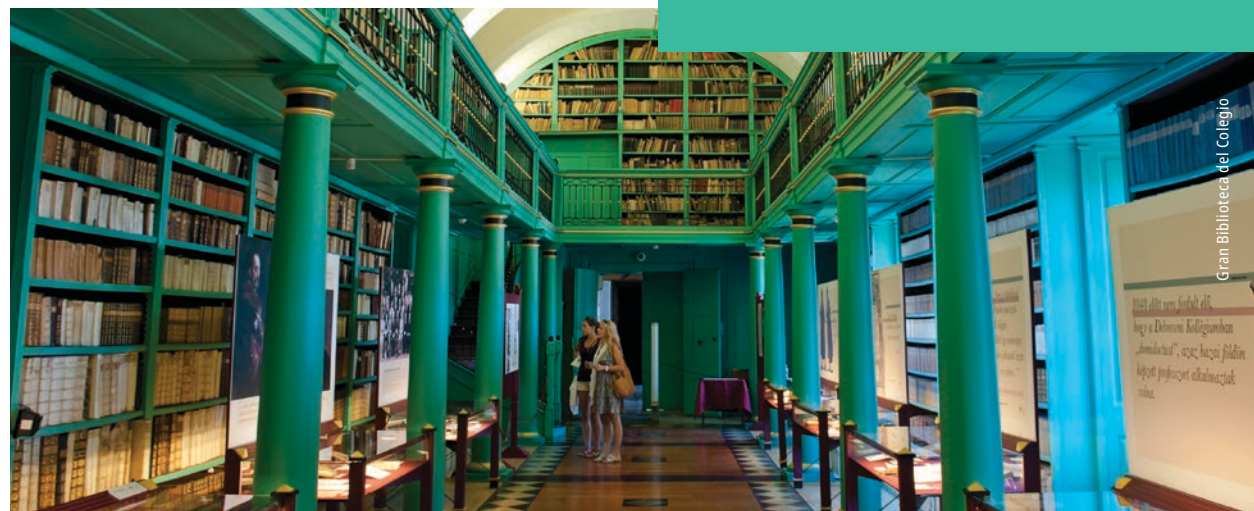
Gran Biblioteca del Colegio

Si ya está cansado, también podrá recorrer la ciudad en el tranvía número 1, ya que el itinerario de esta línea inaugurada en 1911 pasa por la Iglesia Trunca, el antiguo ayuntamiento, la Gran Iglesia, la Torre de Agua y la universidad.