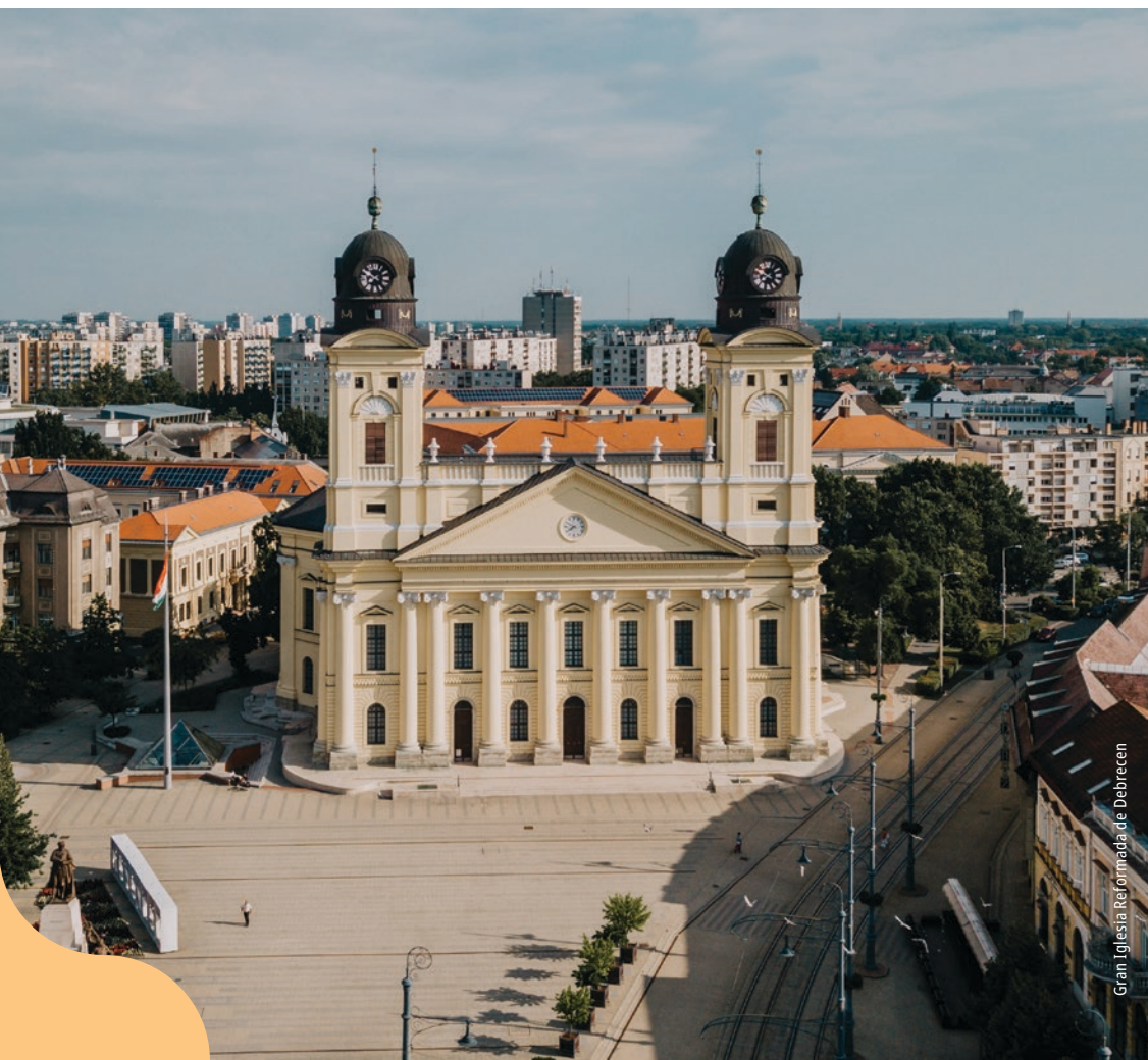
Gran Iglesia Reformada de Debrecen

Durante 300 años, la calle principal de Debrecen albergó las famosas ferias de Debrecen. Comience su paseo desde el hotel Aranybika (Toro de Oro) construido en estilo modernista –diseñado por Alfréd Hajós, el primer medallista de oro olímpico húngaro– que ha sido el hogar temporal de muchos artistas y celebridades húngaros desde su construcción.