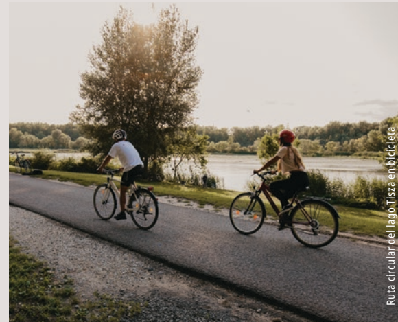
Ruta circular del lago Tisza en bicicleta