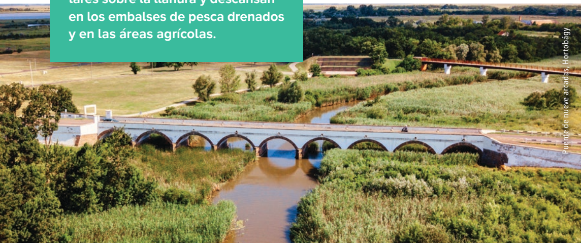
Puente de nueve arcañas, Hortobágy

Visite también el emblemático Puente de Nueve Arcadas de Hortobágy, construido entre 1827 y 1833. Con sus 167 metros de longitud, es el puente pétreo de vía pública más largo de la Hungría histórica.