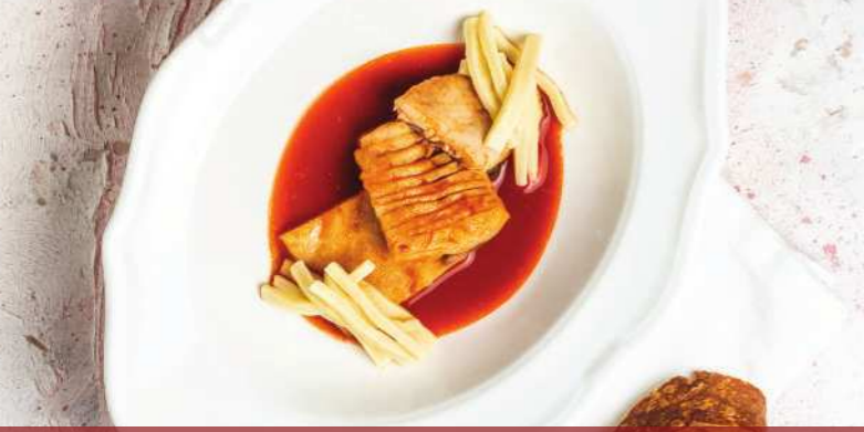
Als würde man ZU HAUSE ANKOMMEN