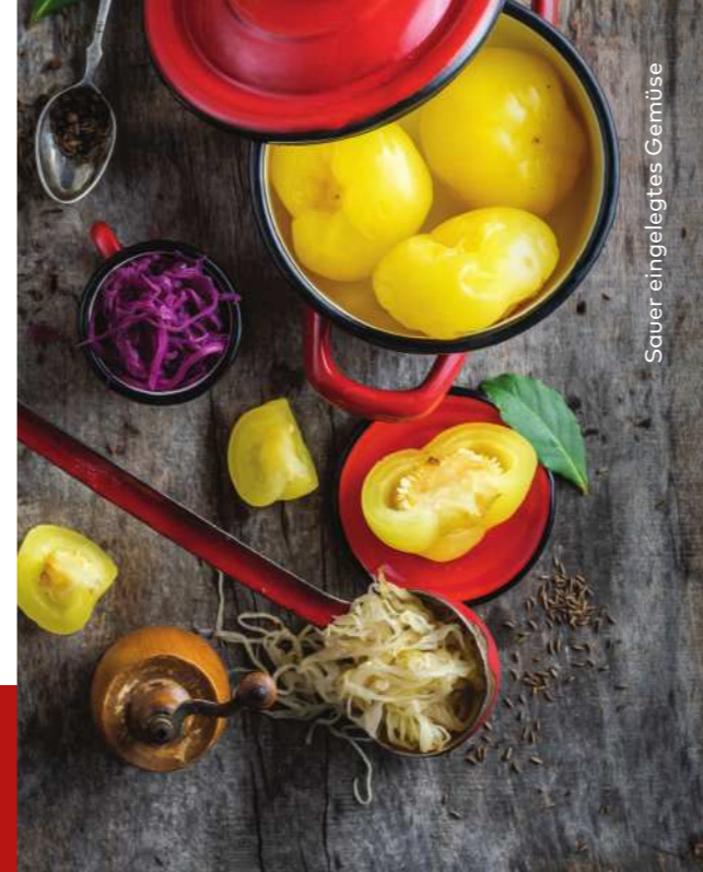
Sauer eingelegtes Gemüse