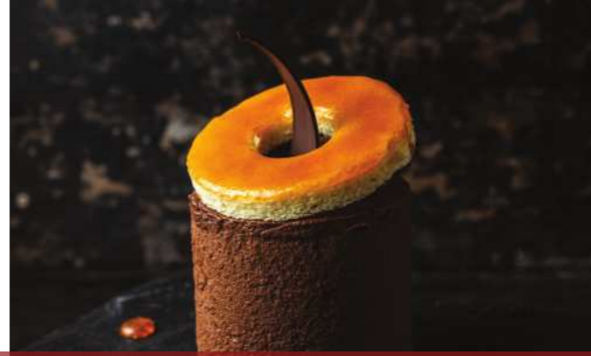
Visionäre des heutigen ungarischen KONDITORHANDWERKS

Der mit geräucherter Paprika servierte Liptauer ist eine mit Butter cremiger gestaltete Quarkcreme mit harmonischen ungarischen Gewürzen, die in diesem Fall aus einer Mischung von Kuh- und Schafsqquark hergestellt wird. Für Spannung sorgen die auf Buchenholz gegrillten Paprikas in verschiedenen Farben, in die diese Füllung kommt. Das Gericht repräsentiert wahrhaftig das, wofür das Restaurant steht: Verwendung von einheimischen Zutaten und ungeborene Qualität, die die Gäste in lockerer Atmosphäre ganz unmittelbar erleben können.