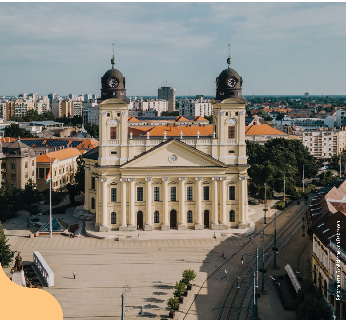
Reformierte Großkirche von Debrecen

Die Hauptstraße Debrecens war für 300 Jahre der Schauplatz für die berühmten Debrecener Märkte. Beginnen Sie Ihren Spaziergang beim im Stil der Sezession errichteten Hotel zum Goldenen Stier, das von Alfréd Hajós, dem ersten ungarischen Goldmedaillengewinner bei den Olympischen Spielen, entworfen wurde. Hier fanden seit seiner Fertigstellung zahlreiche ungarische Künstler und Berühmtheiten eine vorübergehende Bleibe.